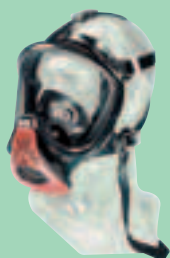
Ultra Elite-PF D2056741

Vollmasken für Zweiwegatmung, mit federbelastetem Ausatemventil. Für Pressluftatmer und Druckluft-Schlauchgeräte mit entsprechendem Überdruck-Lungenautomaten.