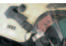
Adapter für Masken- Helm-Kombinationen – exklusiv von MSA AUER