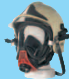
Ultra Elite-H-PF-ESA-F1 10045895