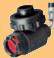
LA 88-AS D4075906