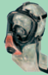
Ultra Elite-PS m. Transponder 10026552