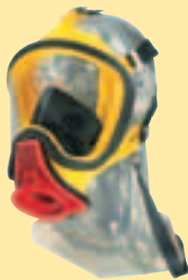
Ultra Elite-PS-MaXX-Silikon 10031384