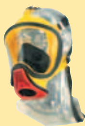
Ultra Elite-PF-Silikon D2056763