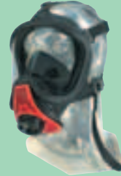
Ultra Elite-PF-ESA 10031393