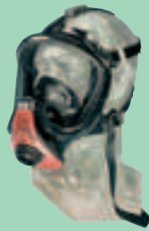
Ultra Elite-PS D2056751