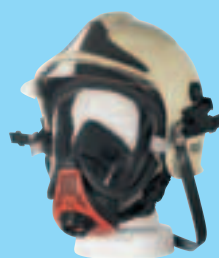
Ultra Elite-H-PS-F1 10045897