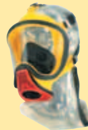
Ultra Elite-PF-ESA-Silikon 10031396