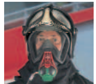
Sichtscheibe in flachem Design für ausgezeichnete Sicht