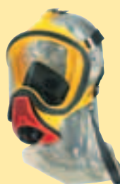
Ultra Elite-PS-Silikon D2056764