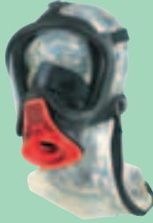
Ultra Elite-PS-MaXX 10031385