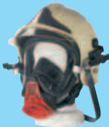
Ultra Elite-H-PS-MaXX-F1 10045899