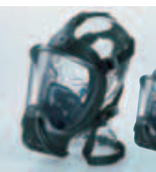
Erhältlich in Standard- größe oder in „small“