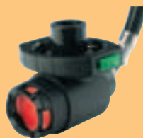
LA 96-ESA 10037893