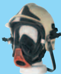
Ultra Elite-H-PF-F1 10045893