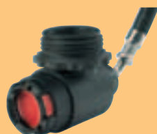
LA 96-AE D4075851