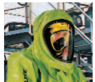
Perfekter Sitz unter Vollschutzkleidung durch ergonomisches Design