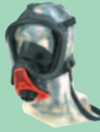
Ultra Elite-PS-EZ D2056772