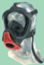
Ultra Elite-PF-EZ D2056771